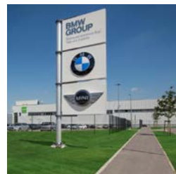
Augsburg Logistics Centre