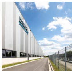
Hamburg Interlink Logistics Centre

Seit dem Jahr 2004 ist Goodman auch in Deutschland tätig. Das Unternehmen hat sein Portfolio in dieser Zeit stetig weiterentwickelt. Goodman besitzt, entwickelt und verwaltet hochwertige Logistik- und Gewerbeflächen an zentralen Standorten im ganzen Land. In der aktuellen bulwiengesa-Studie „Logistik und Immobilien 2017“ wird Goodman als führender Entwickler in Deutschland genannt. Aktuell verwaltet Goodman hierzulande rund 3 Millionen m 2 gewerbliche Immobilien (Stand März 2017).