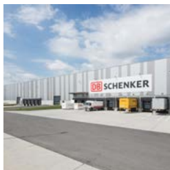
Nuernberg Logistics Centre